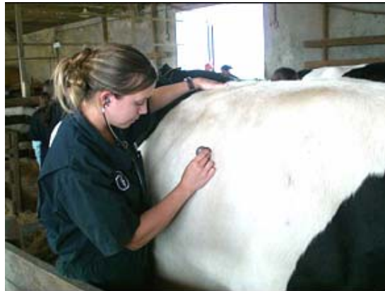
Figura 1: Use un estetoscopio para revisar corazón, pulmones y anomalías en rumen.

Para conducir un examen físico básico, debemos aprender las características normales en la vaca. Por ejemplo, la frecuencia cardiaca normal de la vaca es de 60-70 latidos por minuto, tasa respiratoria 30 respiraciones por minuto, temperatura ~38.6 °C (101.5 - 102 °F), y los movimientos ruminales ocurren una o dos veces por minuto.